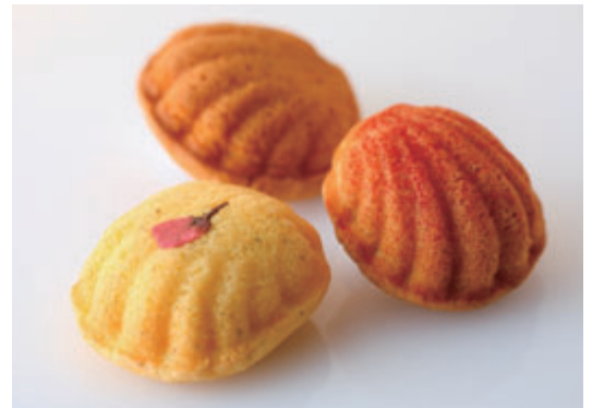
手前から：桜のマドレーヌ、フランボワーズのマドレーヌ、黒蜜のマドレーヌ

出したいというお店が多くて、生菓子ならショックを使わないで売り切るとか、焼き菓子の賞味期限も3日くらいです。せっかくカルピス(株)バターを使っているのだから、香りやコク、味の部分で、一番いい状態で販売したいとおっしゃっていただきます。その一方で、弊社のバターはコスト的に厳しいとおっしゃる方もいらっしゃいます。