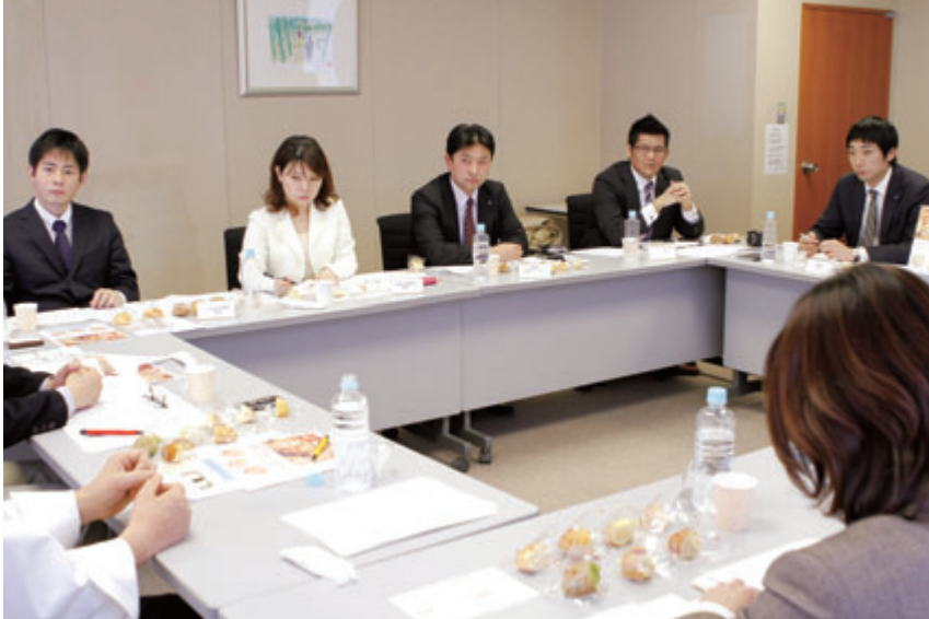
試作品をチェックして会議は進んだ