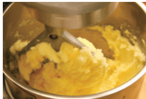
空気を抱きこんで少し白くなめらかに