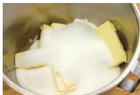
バターと砂糖を合わせるのがポイント