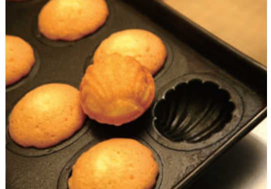
きれいにふんわりと焼き上がる